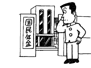
学生の国民年金への当然加入

この場合の納める保険料は、複利現価法で年利五分五厘の割引になります。 例えば、平成四年度の一年間