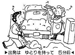
▶出発は ゆとりを持って 5分前◀