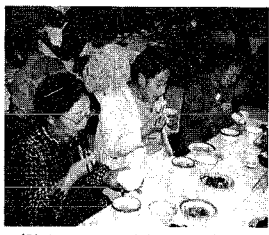
(腕をふるう、食推の方々)

七十歳以上の一人暮らし老人を対象に、食生活改善推進委員や農協婦人部の協力を得て、杜協が実施したものです。一人暮らしになると一度に多くの料理をつくらなければならないので、お茶漬けなど簡単な食事に済ませるなど食事のバランスが失われがちです。