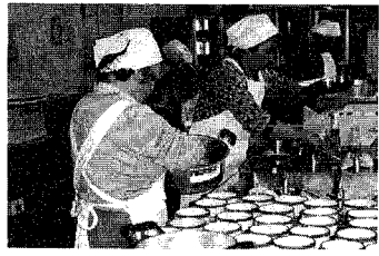
(11月8日 中央公民館にて)