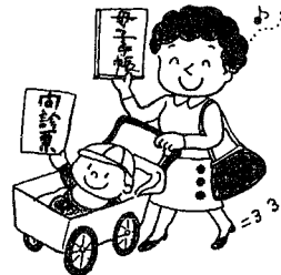
問診票と母子健康手帳は持ちましたか。