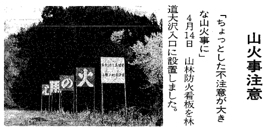
「ちょっととした不注意が大きな山火事に」 4月14日 山林防火看板を林道大沢入口に設置しました。