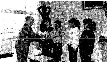
(矢代田小学校児童会の皆さん)