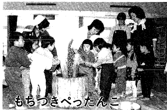
もちつきぺったんこ