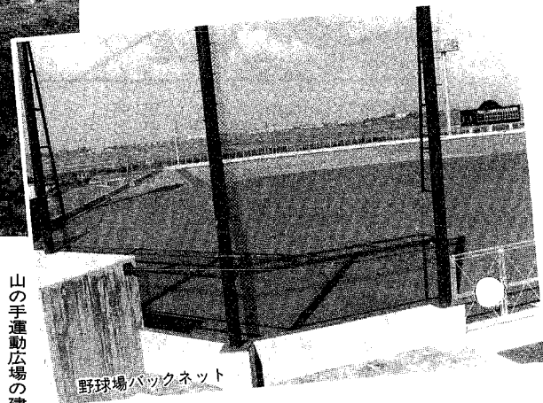
野球場バックネット

山の手運動広場の建設工事が来春四月オープンを目指し着々と進んでいます。その様子を一部紹介します。野球場には、ナイター照明塔が四基と、外野には見易く大きなスコアボード、内野にはタッグアウトが設置されています。野球のさかな当町にふさわしい施設です。来シーズンにはナイターリーグで活用できます。その他、テニスコート四面と、ゲートボール場、小さな子供達の遊び場としての自由広場、管理棟があります。多くの人に利用していただけるよう広い駐車場も完備しています。六十五年度には、運動広場から国道側の丘の上に屋内施設も建設される予定であり、まさにスポーツの拠点となります。