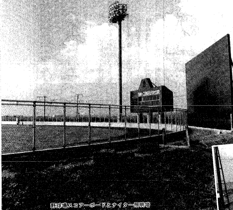
野球場スコアボードとナイター照明塔