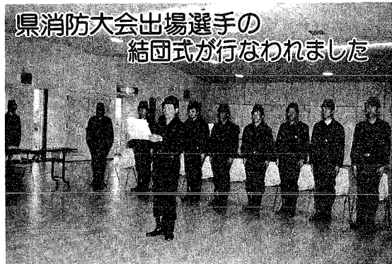
県消防大会出場選手の結団式が行なわれました 8月2日に新潟県消防大会が津川町で開催されますが、この大会の小型ポンプ操法競技大会に小須戸町の消防団が三市中蒲原地区の代表として出場することになりました。その結団式が4月7日に中央公民館において行なわれました。選手の皆さんは、優秀な成績を収めるため4月20日より練習に励んでいます。