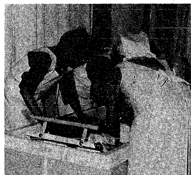
集合デイケア事業の入浴サービスの様子

人口の高齢化に伴い、痴呆性老人の問題が大きな社会問題となりつつあります。 小須戸町では、新津保健所・中浦社会福祉事務所との共催で、去る三月十九日に老人福祉センターにおいて、痴呆性老人をかかえる家族のつとどいを開催しました。 これは、介護する家族が「呆け」についての正しい知識と介護方法を学ぶことを目的とし、