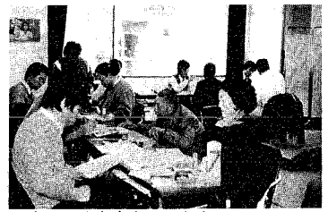
昨年の確定申告のようす

このような重要な役割を果たしている税金の使いみちを十分理解していただくため、今年も十一月十一日から十七日まで「税を知る週間」が実施されます。税金について、困ったことや分からないことがありましたら、いつでも最寄りの税務署か税務相談室へご相談ください。 なお、税理士会新津支部では左記のとおり税の無料相談を開きます。