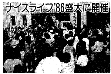
開催に盛大なスライフ'86

昭和62年度新入学児童の就学時健康診断を、次の日程で行いますので、入学児童のおられる方は忘れずに当日受診してください。 なお、就学予定者には案内状が届いていると思いますが、ありませんでしたら、至急教育委員会へご連絡ください。 ★小須戸小学校 11月11日(火) 午後1時30分より ★矢代田小学校 11月5日(水) 午後1時30分より ※この健康診断は、児童の入学後の保健指導や健康管理に役立てるためのものですから、必ず受診してください。