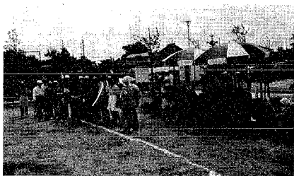
交通安全防止についての話しを熱心に学びました。

さる7月14日、横浜浜葉落開発センター(農村公園)において、横水地区老人クラブ連合会(参加者55名)を対象に交通安全教室が開催されました(写真)。