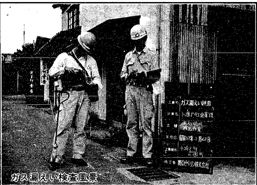
ガス漏れ検査風景