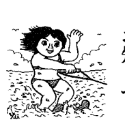
屋外広告物講習会のお知らせ

暑い夏の陽で木も元気を失ってきました。町道にまで出てくる枝が、通行上非常に妨げとなっている状態が見受けられます。そのため、道路へ出て見てください。切るなり整理をお願いいたします。 道路に出ている枝の整理を!!