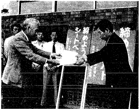
(立看板寄贈の様子)

今年、原爆被爆39年を迎えるに当たり、広島市と長崎市で原爆死没者の慰霊及び平和祈念の式典が行われます。ついては、広島市では8月6日原爆が投下された午前8時15分に、長崎市では8月9日の午前11時2分に、それぞれ原爆死没者のめい福と世界の恒久平和の確立を祈念し、黙とうをささげることにしています。町民の皆様もこの趣旨御理解をし黙とうをささげてください。