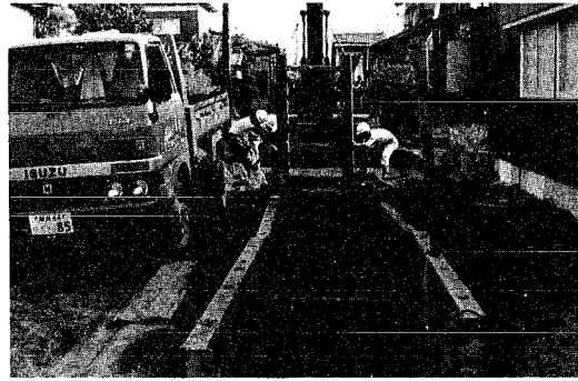
(下水道工事のようす)