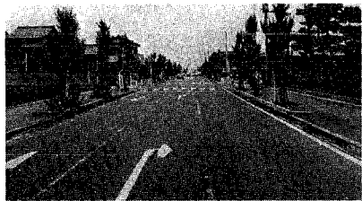
(中央線：道路をつくるのも建設課の仕事です)

下水道事業は、着手以来五カ年になりますが、国の公共事業の抑制により事業が遅れています。新しい小須戸小学校の開校までに一部供用開始ができるよう努力していますのでご理解をお願いいたします。 また、都市計画街路事業(中央線)については、五百メートル区間は昨年供用開始をし、残り二百五十メートルについては現在用地買収等、ご協力を願っていますので、早期に全面供用開始となるよう努力しています。 建設課は、特に道路改良、水路整備、道路舗装、道路除雪、住宅建設など、住民の皆さんと直接現場に密着した事務事業を