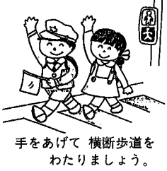
手をあげて横断歩道をわたりましょう。

運転は気くばり、目くばり、思いやり (運転者向け) 危険です その信号の変わりばな (歩行者、自転車乗用者向け) 自転車も、のれば車のなかま (こども向け)