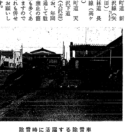
除雪時に活躍する除雪車

尚、工事の実施前に関係住民の方を対象に工事説明会を行ないますので、よろしくご協力をお願いします。 脱臭扇の 訪問販売に ご注意 (トイレトファン) 最近、県下各地で、あなたも東北電力から依頼されてきたかのような口ぶりで、脱臭扇(トイレトファン)を訪問販売し、危機感を煽りながら、まだ充分に使えない器具までも取替えてまわる業者があり、消費者からの苦情が相次いでおります。 当社および当社の関連会社では、脱臭扇の販売等は一切行っておりません。こうした業者とは何の関係もありませんので、ご注意ください。 (東北電力(新津営業所)) (3) 町道 新三沢線(矢代田) (4) 林道 長峰線(高ヶ沢) (5) 町道 天ヶ沢下道 (6) 町道 大沢道 (7) 町道 大沢道 (8) 町道 大沢道 (9) 町道 大沢道