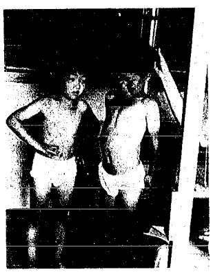
昨年(昭和五十六年)の新入学児童 入学前健康診断

新入学児童 入学前健康診断が行われます 昭和五十七年度新入学児童の入学前健康診断を、つぎの日程で行いますので、入学児童のおられる方は忘れずに当日受診されるようお願いいたします。 なお、就学予定者には、近く案内状が届くことになっておりますが、もし該当者で通知がない方がありましたら、至急役場教育委員会(二階)へご連絡ください。 ◇小須戸小学校 十一月十日(火) 午後一時三十分 ◇矢代田小学校 十一月十二日(木) 午後二時三十分 この健康診断は、児童の入学後の保健指導や健康管理に役立てるためのもので、必ず受診してください。