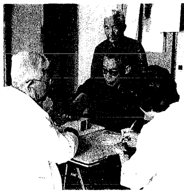
健康診断における 血圧測定

九月七日から十六日まで、町の健康診断が行われ、十七日と十八日の二日、精密検査が行われました。