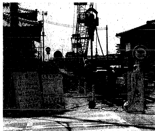
下水道本管布設工事 (車庫線)

先月に引き続き五月の説明会で皆様から出された質問についてお知らせします。 (問) 現在「尿浄化槽を設置している家庭では、下水道が整備された場合、どのようにすればよいのですか？ (答) 下水道の整備が終わり、使用できるようになりますと汲み取り式便所の場合、三年以内に水洗便所に改造し下水道管へ接続するよう法律で義務付けられておりますが、浄化槽設置家庭の便所の接続までは義務付けられておりませんが、まわりの人達に与える心理的影響及び維持管理の面からも、下水道を利用した方が得策かと思われまうので、積極的に下水道への接続を指導していく方針です。 尚、浄化槽設置家庭でも一般家庭汚水(台所、風呂などの汚水)については、下水道への接続が義務づけられております。 (問) 年次別に工事施工箇所を明示してもらいたい。 (答) 年次ごとの計画箇所は、国からの予算等の関係ではっきり決められませんが、翌年度の予定箇所について