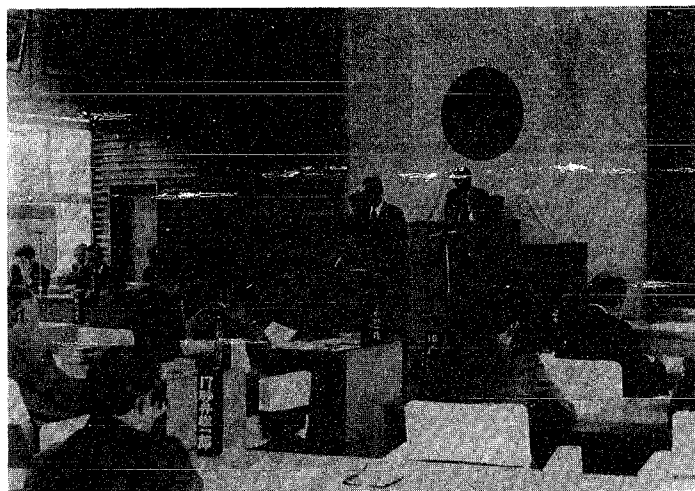
提案理由を説明する町長

今議会に提出された議案は条例の一部改正三件、条例の廃止が一件、人事案件が二件、予算補正二件並びに決算認定三件の十一議案及び発議一件、請願一件が審議されました。