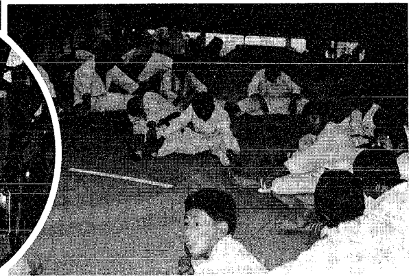
柔剣道場竣工式から