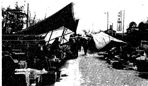
左：堤防上の市も今月限り

昭和34年以来、町裏裏防で開設しておった三・八の小須戸市場を、3月3日の市日から、小須戸保育園前の児童公園内に移転開設いたします。