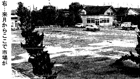
右：来月からここで市場が

町では、事務の合理化及び簡素化を図るために、本年四月一日から皆さんのご理解とご協力を得て、次の税金や使用料などについて、預金口座振替制度の方法を採用いたすことになりました。