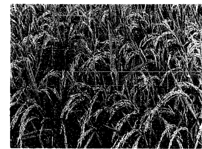
稲の収穫期に入りますが、最近ホ場で脱穀、生籾乾燥と稲作体系も変わり収穫作業もコンバイン等を利用して毎年ののに代って毎年ワラの大半は田で焼却され、時には煙公害を発生させております。