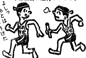
職場をやめたときには国民年金の届出を忘れずに……

通算される加入期間は、原則としてひとつの年金制度の加入期間が一年以上あつて、かつ昭和三十六年四月一日以降の加入期間です。(厚生年金、船員保険、各種共済組合など8つの公的年金制度です。)