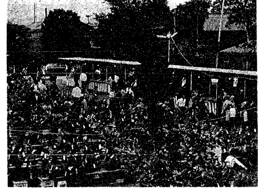
昨年の植木・盆栽まつり風景

五月二日から五日まで、小須戸町園芸組合の主催により第二回「植木・盆栽まつり」が大川前四丁目の児童遊園地に開催されます。この機会に各家庭でも、花と緑の庭づくりをするためご利用ください。