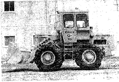
除雪の出動を待つペイローダー

降雪の時期になりました。町では降雪二〇cmになりますと除雪作業をやりませんが、毎年ブルドーザーの運行に支障のある箇所が見受けられますので、次の点について皆さんのご協力をお願いいたします (1)道路に垂れさがる木、又は竹の枝の切り落とし (地上三m以内垂れさがりの枝) (2)道路上に駐車されている車 (3)その他ブルドーザー運行に支障となる物品の放置 ※なお違法駐車及び物品の放置等の場合における処置は警察の取締りがありますからご注意ください。