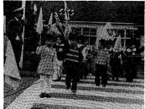
交通指導隊による交通安全教室 (小須戸保育園)

五月十二日から五月二十一日までの十日間「春の全国交通安全運動」が町民総ぐるみで実施されました。今年、選挙の関係で実施期間が遅くなったが、全体会議では色々な活発な意見がありまたあらゆる団体、職場から街頭指導や交通安全教室の開催など、大きな協力のものと幅広い運動を展開することができました。