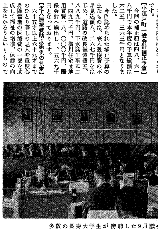
多数の長寿大学生が傍聴した9月議会

【小須戸町一般会計補正予算】 今回の補正額は四八、六一八千円で本年度の予算総額は六二五、三六三万円となりました。今回認められた補正予算の主なものは、老人医療費の不足見込額八、二六七千円をはじめ、道路の改良舗装費五、八八九千円、下水路工事二、四九三千円、横川住宅団地用買費一八、〇〇〇千円、国保会計へ繰出し、五六九千円となっております。