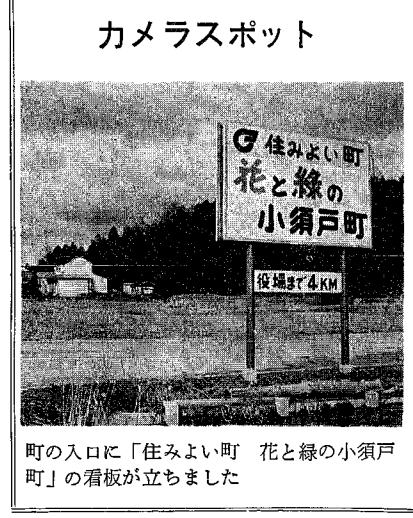
町の入口に「住みよい町 花と緑の小須戸町」の看板が立ちました

信濃川の副堤 工事について 問 去年の秋から小 須戸橋の上手に堤防 工事が始められてい ますが、どうなるん でしょうか。 答 ご承知のとおり 今まで豪雨のたびに 中小河川が氾濫し刈 谷田川や加茂川をは じめ、支川の改修工 事が急速に進められ てきました。そこで 本流の信濃川の水量 が増えますので、建 設費では年次計画で 信濃川の副堤工事を 施工しているわけで す。小須戸橋の上流 二〇〇米は近く完成 の予定です。 今年度は更に上流三 九〇米と下流一八〇 米、四十九年度には 下流一三六〇米の副 堤工事が計画されて います。 上流は堤防に添って 副堤が出来ますが橋 の下流では一部川に 沿って新しい副堤 が出来ると見込んで います。なお排水は副堤の東 側に一米位の排水溝 が予定されています 開発振興課