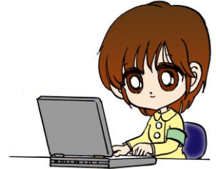
(キャラクターデザイン 高橋郁丸)