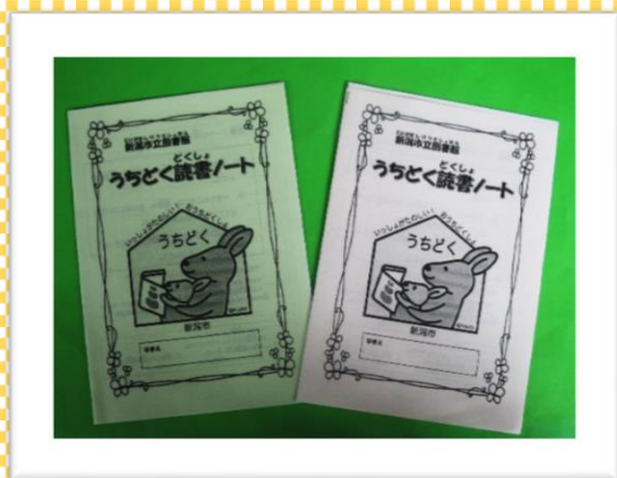
←うちどく読書ノート