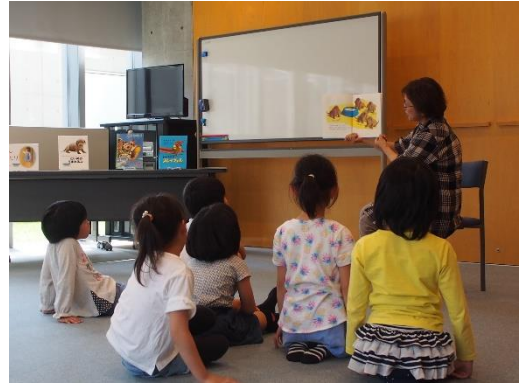
豊栄図書館 春のおたのしみ会