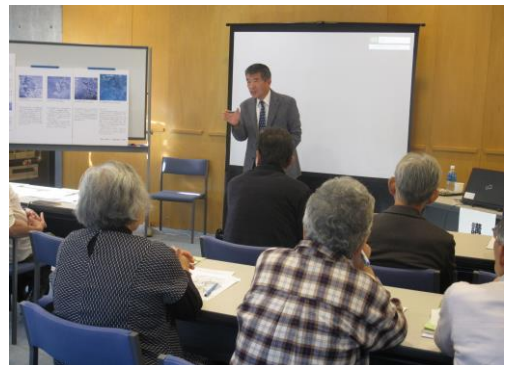
豊栄図書館 文化講座