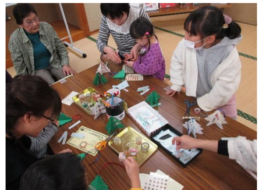
松浜図書館 クリスマス会