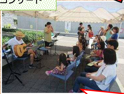
青空しらかし コンサート