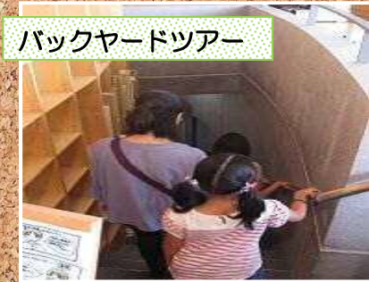
バックヤードツアー

豊栄図書館応援団の皆さんが毎年恒例の夏まつりを開催しました。 古本市での募金は東日本大震災義援金として、赤十字に寄付されました。 ご参加いただいた皆さん、ありがとうございました。 おかげさまで、大盛況でした!!