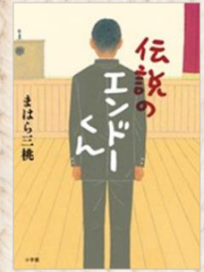
まはら三桃/著 (小学館)

「エンドーくん」はなぜ伝説になったのか、その人物とは一体だれなのかを推理しながら読み進めるのも楽しい一冊です。 (大木)