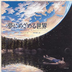
ロブ・ゴンサルヴェス/作 金原瑞人/訳 (ほるぷ出版)

海を泳いでいたと思ったら、いつのまにか空の上。たくさんの落ち葉かと思ったら、それは蝶の群れ……ページをめくるたび、奇妙で不思議な世界が広がります。