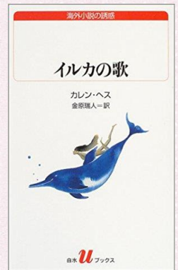
カレン・ヘス／著 金原瑞人／訳 (白水社)