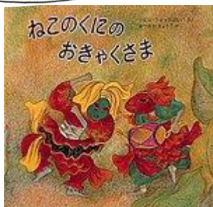
シビル・ウェッタシンハ／さく まつおかきょうこ／やく 福音館書店

海を越えたはるかかなたに、働き者の猫が暮らす国がありました。何不自由ないけれど、何か足りない気のするこの国に、ある日不思議なおきやくさまが二人、船に乗ってやってきました。大きな仮面かぶって目の覚めるような色の衣装を着たこの二人が猫たちに披露した「音楽と踊り」は、今まで知らなかった「楽しむこと」をこの国にもたらしました。スリランカの作家が描く色彩鮮やかな絵もとても美しい1冊です。