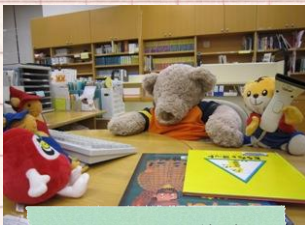
カウンターを体験!