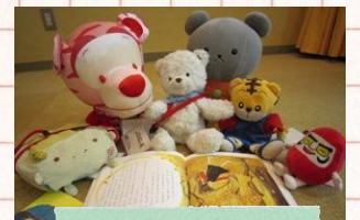
紙しばいや絵本 を楽しんだよ!

楽しいお話を聞いた後、 ぬいぐるみたちは図書館におとまりします。 おむかえの時に、夜の図書館を冒険した ぬいぐるみたちの写真をプレゼント!