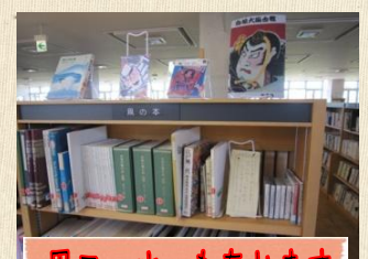
風コーナーもあります

図書館の入口から入って左手側に毎月テーマ展示を行っています。そのほかにも入口正面にミニ展示を行っています。2週間ごとにテーマを変え、資料を展示しています。今の時期はやっぱり白根大風合戦！白根大風合戦の歴史や風の作り方など様々な風資料をご用意しています。(風資料は風コーナーにもあります。)ぜひご利用ください。