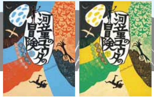
『河童のユウタの冒険』(上・下巻) 福音館書店 斎藤惇夫/作 金井田英津子/画